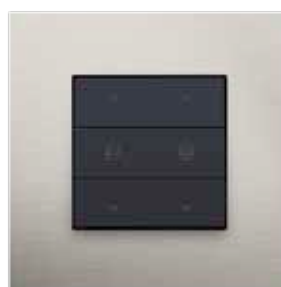
Commande de moteur double